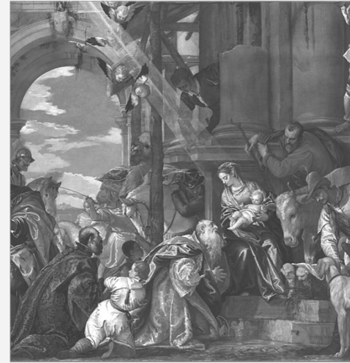
La Adoración de los Reyes Magos de Paolo Veronese