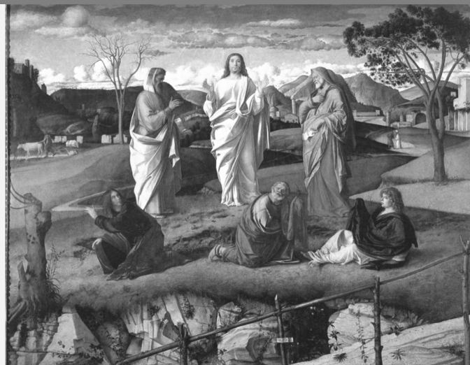
La Transfiguración de Cristo de Giovanni Bellini