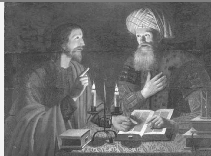
Cristo y Nicodemo de Crijn Hendricksz Volmarijn