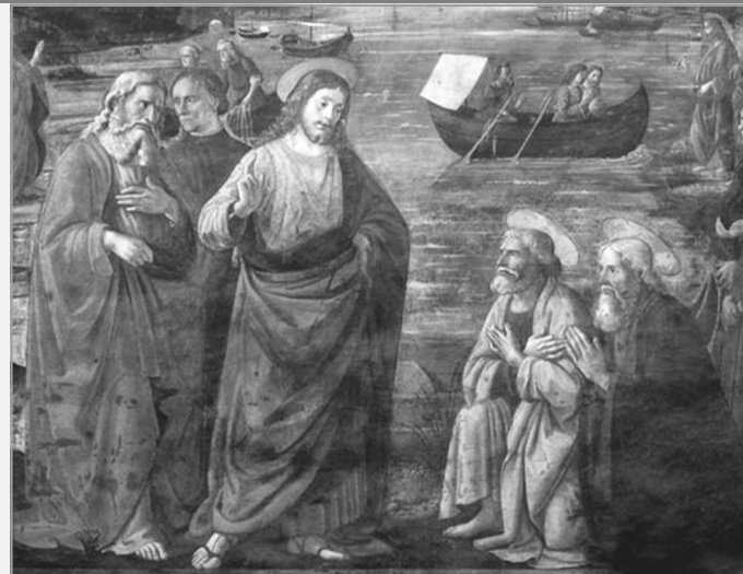
La Vocación de San Pedro y San Andrés de Ghirlandaio