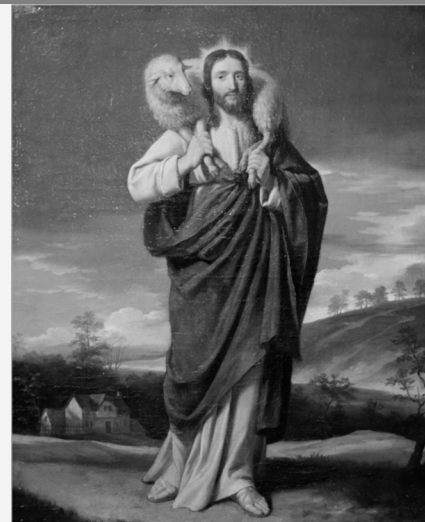
El Buen Pastor de Philippe de Champaigne